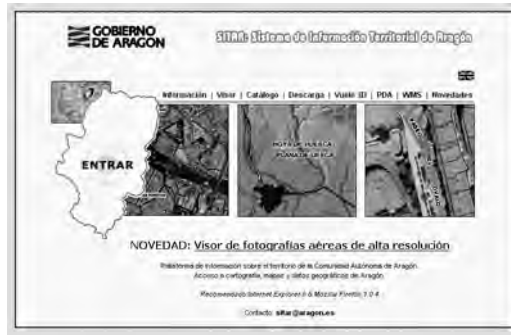
Figura 8. Portal del Sistema de Información Territorial de Aragón (SITAR), donde se implementará la descarga de la cobertura del MHA.

Agradecimientos. El proyecto ha contado durante 2005 y 2006 con el 50% de financiación FEDER, Objetivo 2 de Aragón, en la Unidad 2.4.4 “Red Natura 2000”.