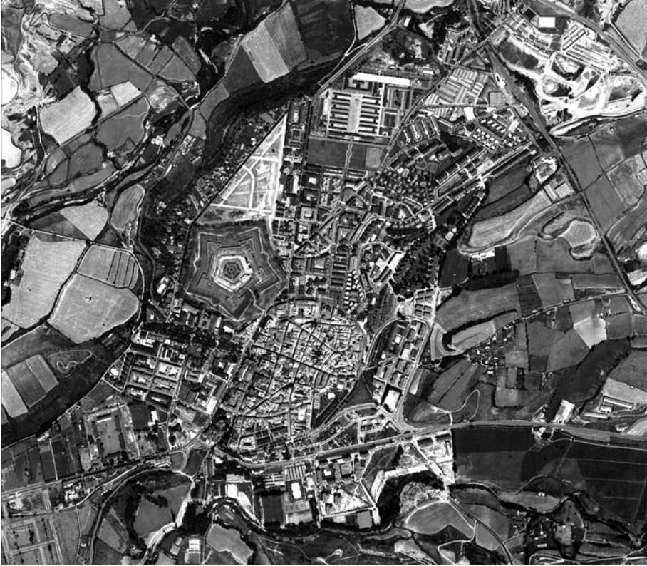
Figura 3. Ortofoto a color usada para la cartografía de hábitats de Aragón. En la imagen vemos Jaca y sus alrededores.