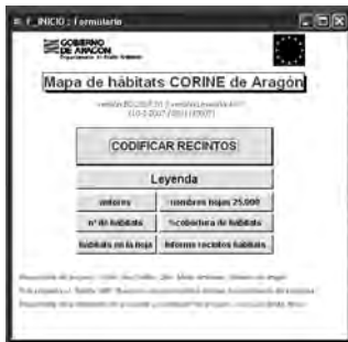
Figura 5. Pantalla de presentación de la base de datos del Mapa de Hábitats de Aragón.

Además, se creará otra cobertura para cada hoja en la que se incluirá información complementaria como la fecha de los ortofotomapas empleados, la fecha del levantamiento del mapa, fecha de finalización o de actualización, estado de la hoja (definitivo, provisional, pendiente de revisión), etc.